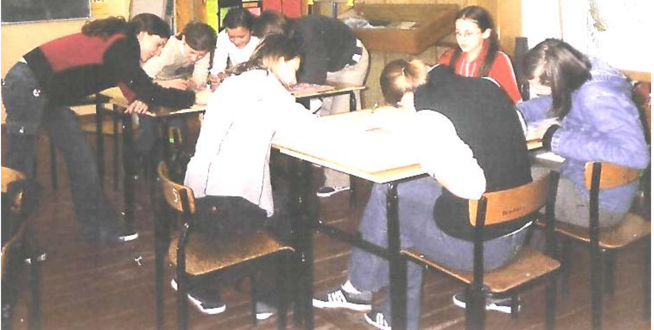
Członkowie „Europejczyka” w czasie wykonywania plansz nt. państw, które 1 maja 2004 r. przystąpiły do UE – opracowywanie planszy o Polsce.

Z okazji wejścia Polski do Unii Europejskiej Szkolny Klub Europejski przy Publicznym Gimnazjum w Olesznie postanowił podjąć szereg zadań, których głównym celem było przybliżenie uczniom wiedzy o krajach wstępujących do UE oraz krajach należących już do Unii.