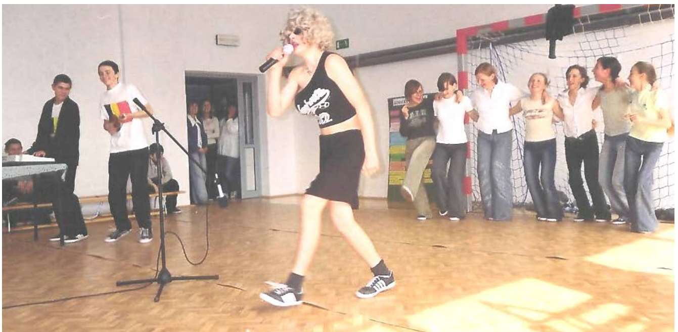
Widzom podobał się też bardzo zespół muzyczny kl. II Gim.

Po zsumowaniu punktów w klasach I – III SP zwyciężyli drugoklasiści, którzy przygotowywali wiadomości o swoim kraju.