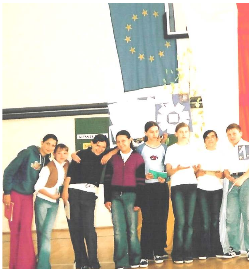
Członkowie SKE EUROPEJCZYK

Akademia odbyła się 7 maja, a więc z kilkudniowym poślizgiem, gdyż wcześniej na sali gimnastycznej odbywały się dwie części egzaminu gimnazjalnego.