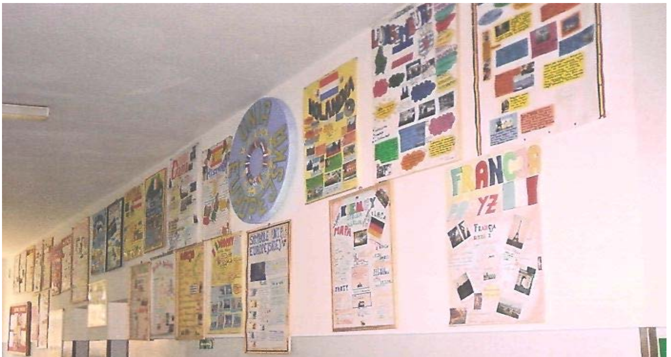
Pełna galeria plansz – prezentowane są wszystkie państwa należące od 01.05.2004 r. do Unii Europejskiej.