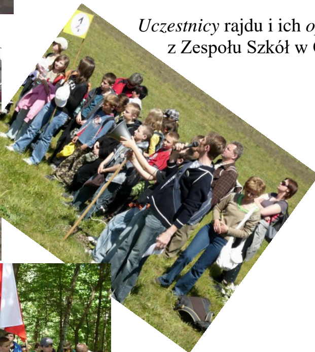
Uczestnicy rajdu i ich opiekunowie z Zespołu Szkół w Olesznie