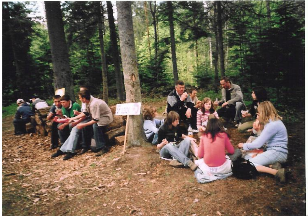
Przerwa na posiłek podczas wędrówki

Motto: „Trzeba, aby ta pamięć o przeszłości trwała i ci, co pamiętają winni przypominać o tych, co odeszli” Jan Paweł II