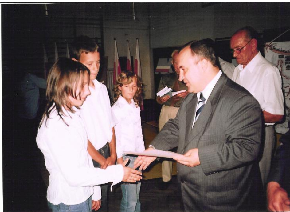
Tu odbieramy gratulacje od wicepremiera Przemysława Gosiewskiego

szlakiem majora „Ponurego” na trasie: Wąchock- uroczysko leśne „Wykus”- Bodzentyn oddając hołd i cześć przy pomnikach i mogiłach żołnierzy AK poległych podczas obławy niemieckiej na Zgrupowanie Partyzanckie „Ponury”.