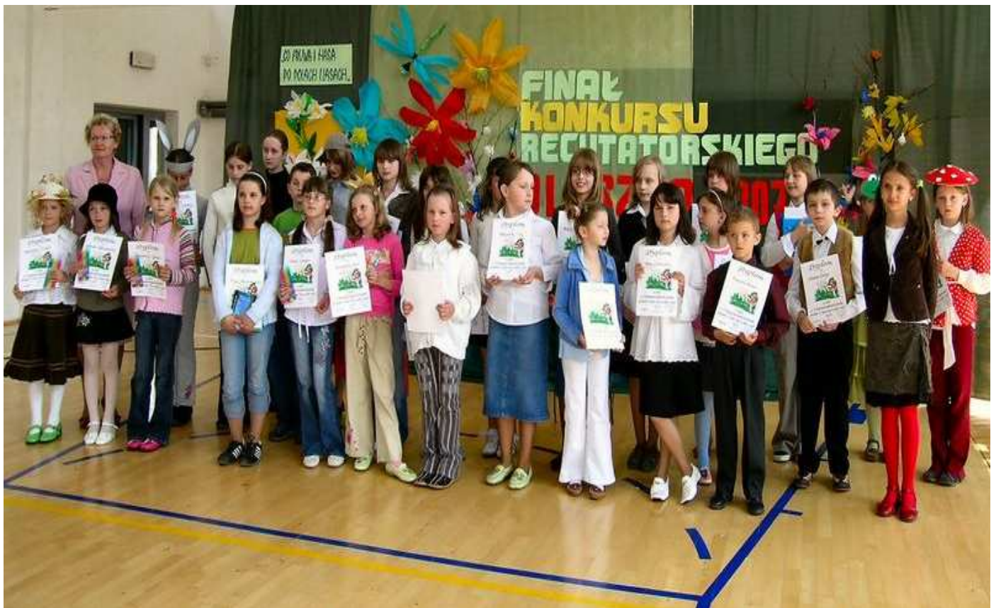
Uczestnicy konkursu „Co fruwa i hasa po polach i lasach”

Bardzo dziękujemy wszystkim sponsorom za coroczne wsparcie finansowe.