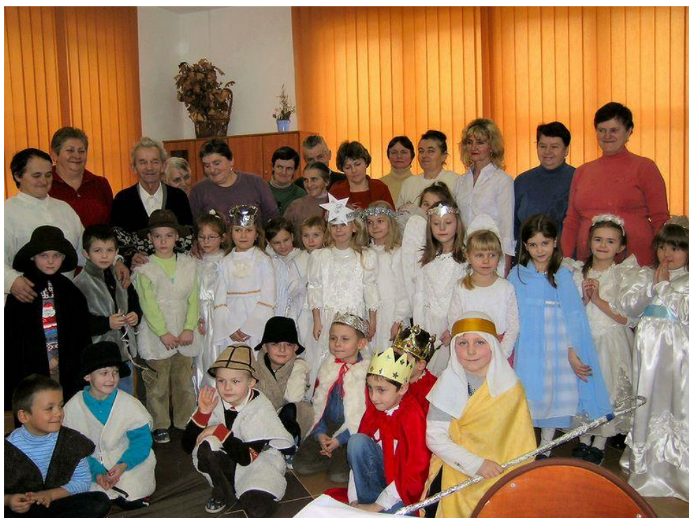
Uczniowie wraz z babciami po zakończonym występie.

Na koniec występu babcie i dziadkowie mocno wyściskali swoje wnuczka za tak piękne przedstawienie, a potem wszyscy razem zjedli „coś niecoś” słodkiego i wypili gorącą herbatę.