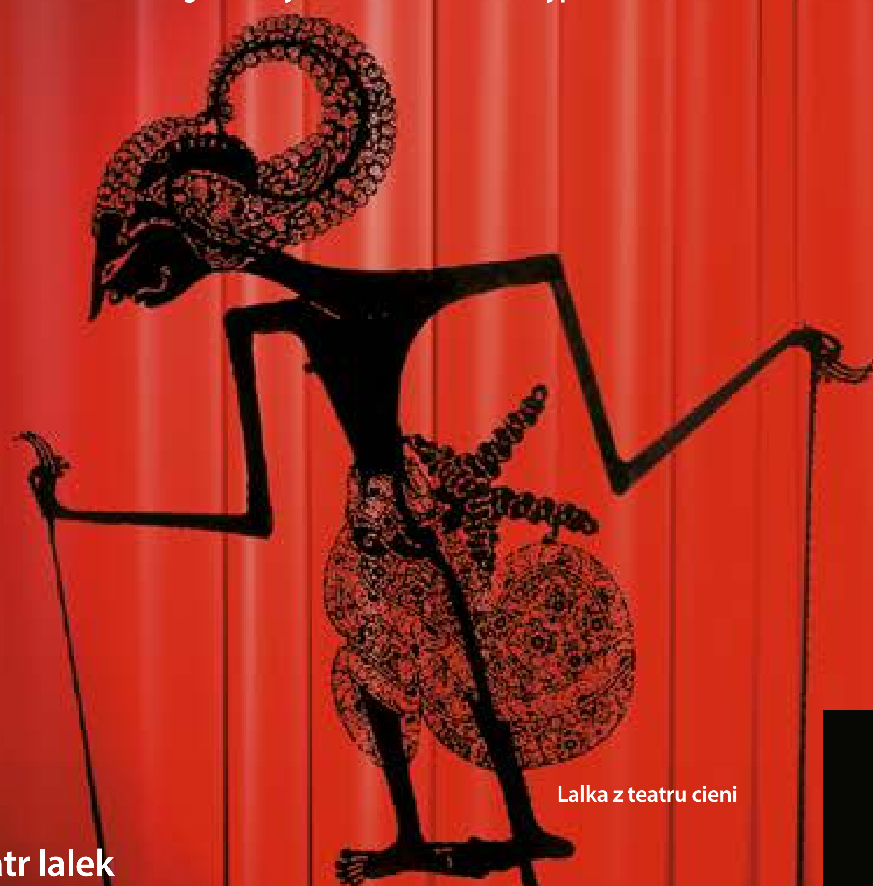
Lalka z teatru cieni

– widowisko wkraczające w powszednie życie miasta, wykorzystujące skwery, parki, ulice, place itp. Jego celem jest dotarcie do szerokiej publiczności.