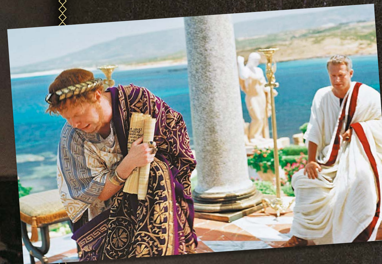
Kadr z filmu Quo vadis w reż. J. Kawalerowicza (2001)

z elementami fikcji literackiej wkomponowanymi w tok wydarzeń historycznych