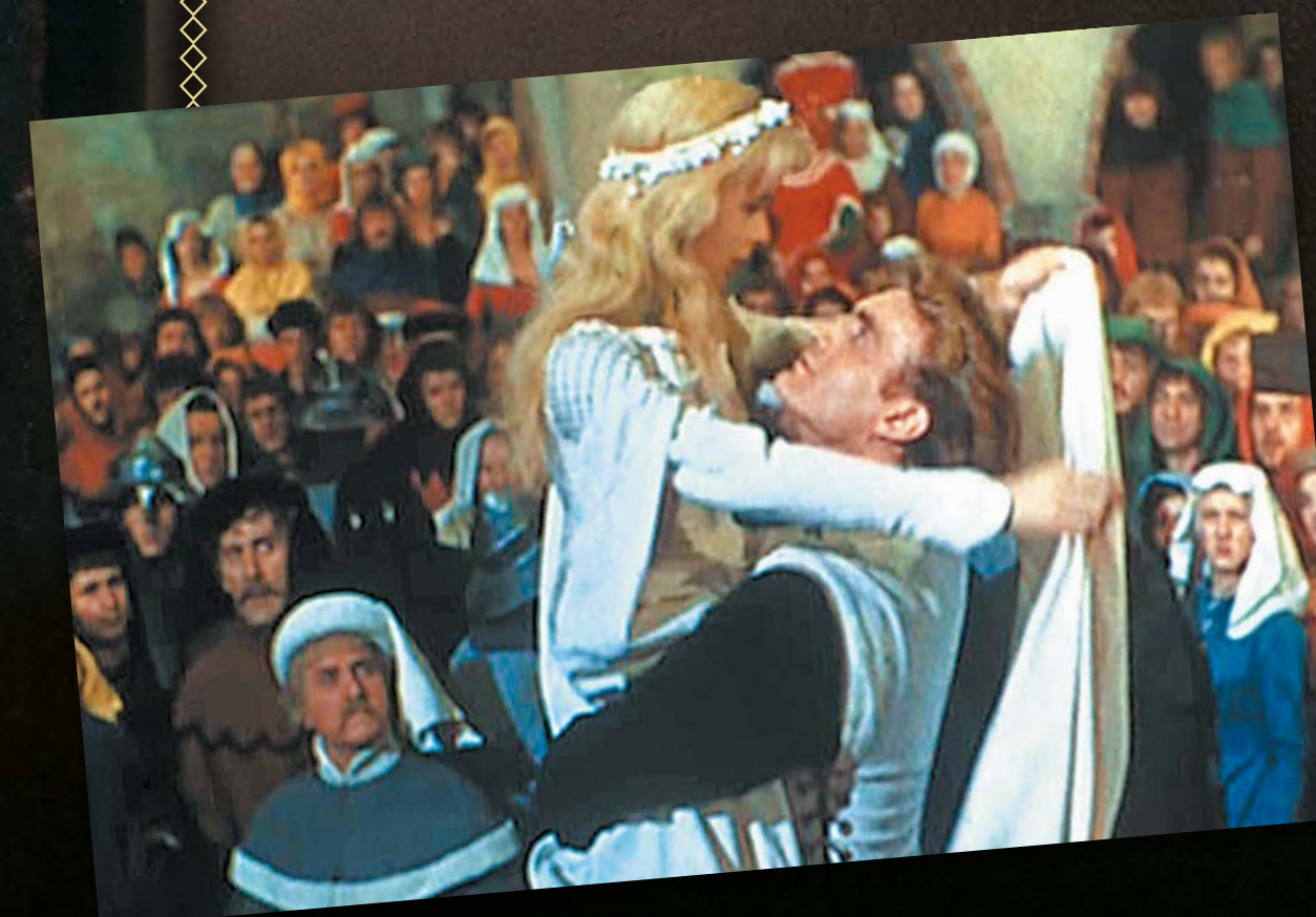
Kadr z filmu Krzyżacy w reż. A. Forda (1960)

Powieść ukazująca dzieje pierwszych chrześcijan za panowania rzymskiego cesarza Nerona (63–69 r. n.e.). Utwór odniósł światowy sukces, przetłumaczono go na ponad 50 języków.