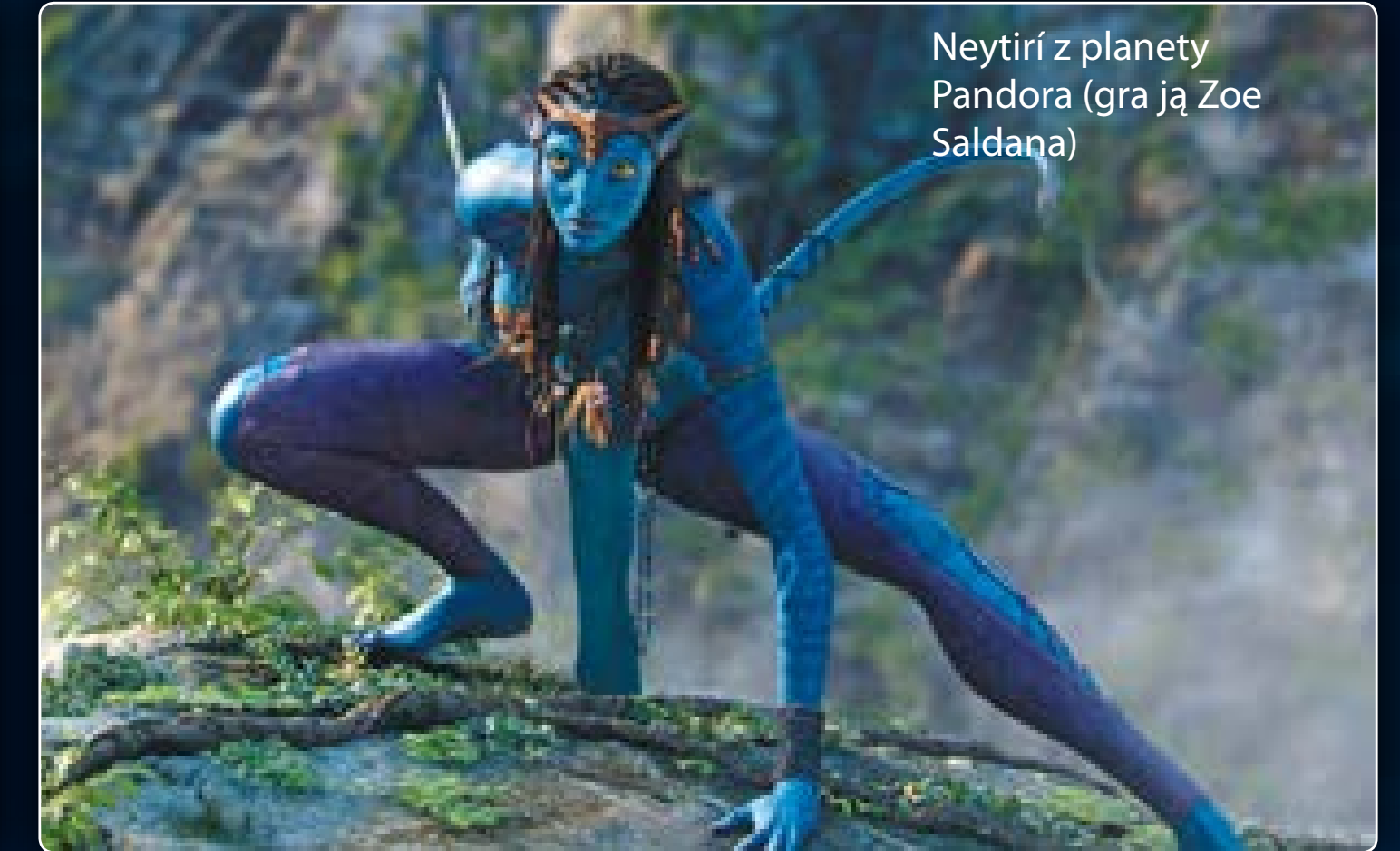
Neytiri z planety Pandora (gra ją Zoe Saldana)